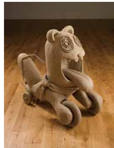
《アメリカンドッグ》2014年