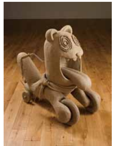
《アメリカンドッグ》2014年