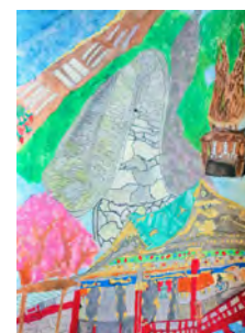
第40回絵画展金賞作品