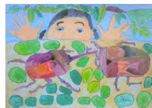
第40回絵画展金賞作品