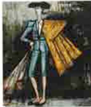
# ベルナール・ビュフェ 「青い闘牛士」 1960 年