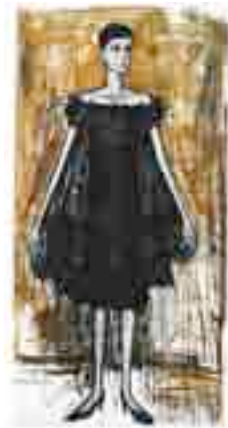
" ベルナール・ビュフェ 「アナベル」 1959 年