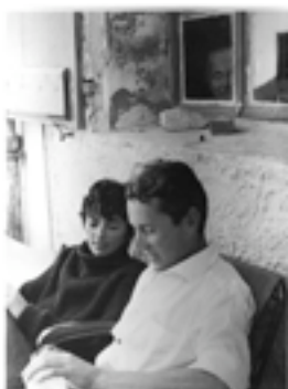
$ リュック・フルノル 「ビュフェとアナベル」 1958 年