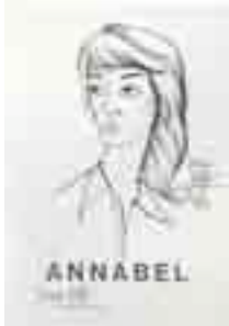
! ベルナール・ビュフェ アナベル展ポスター

画像資料（デジタルデータ）の提供について 以下の作品 4 点について、画像資料をご用意しております。ご希望の場合は、右に必要事項をご記入の上、FAXにてお申し込みください。