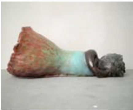
Lying, 1997/2006, Bronze