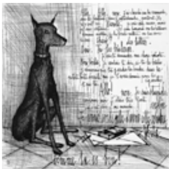
③ ベルナル・ピュフェ 挿絵本『人間の声』より