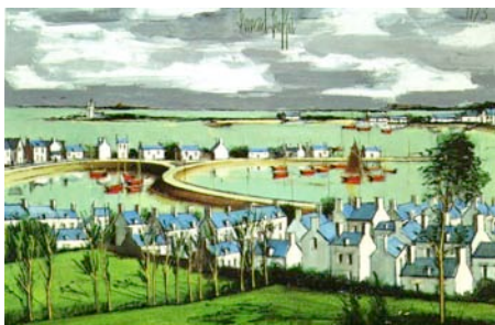
_ ペロス=ギレック 1973年

以下の作品について、画像資料（デジタルデータのみ）をご用意しております。ご希望の場合は、右の必要事項をご記入の上、FAXにてお申し込みください。_必要な画像資料にチェックを入れて下さい。