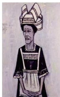
_ ブルターニュの女 1956年