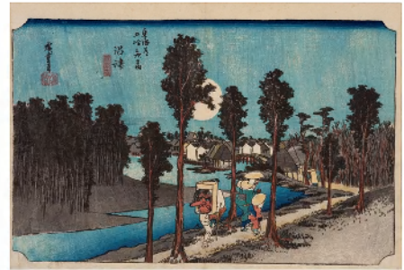
歌川広重「東海道五拾三次」保永堂版《沼津 黄昏図》1833年頃

15歳の時、歌川豊広(1773-1830)に入門し、翌年に雅号・広重を与えられる。天保2年(1831)「東都名所」を発表し、風景画家として本格的に制作し始める。その後、保永堂版「東海道五拾三次」や「木曾海道六拾九次」などの街道絵シリーズで名声を獲得する。晩年に安政3年(1856)から制作した「名所江戸百景」や「富士三十六景」などの風景画揃物がある。