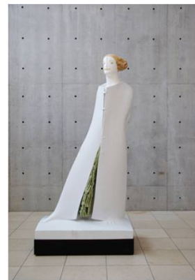
《コートを着た女》 2006年