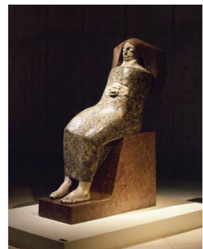
《花柄の服の女》 1991年 ©Shigeo Anzai