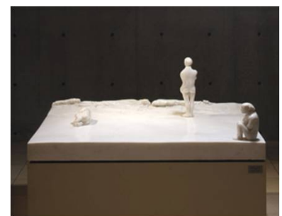
《浜辺の中の三人の人物》1975年