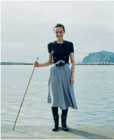
古屋誠一 《Izu 1978》2006年、発色現像方式印画、1470×1240 mm

オーストリア人の妻クリスティーネと古屋の7年半の結婚生活は、妻の投身自殺によって終止符が打たれた。その後、20年以上の長きにわたり古屋は妻の姿を繰り返し展示し、何度も写真集に編み直してきた。その行為は写真を介して妻に会い、妻と過ごした日々を整理し、過去の自分と再び出会う旅路といえる。