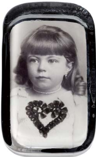
制作者不明（アメリカ）《ペーパーウェイトに収められた少女の肖像》1910年頃、ゼラチン・シルバー・プリント、100×60×16 mm

写真の発明者のひとり、ウィリアム・ヘンリー・フォックス・タルボットが19世紀に制作した紙ネガを自らの解釈でプリントし直すことにより、過去のイメージに新たな光を当てる。わたしたちは杉本の手を経由したタルボットの写真に再び出会う。