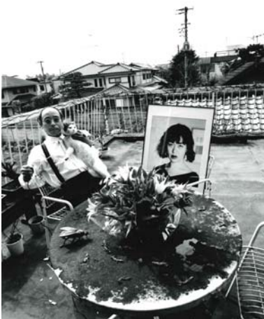
荒木経惟 《東京日和》1993年／2012年、ゼラチン・シルバー・プリント、279×355 mm

2011年に開催された展覧会のタイトル「光は未来に届く」には、写真とは、かつてあった光を、その写真を見る未来の人に届けるもの、という意味が込められており、本作も野口による写真論的作品とみることができる。