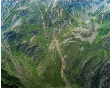
松江泰治 《ALPS 18444》2012年、発色現像方式印画、700×876 mm

世界各地の地表を高所から撮影する松江の作品は、画面の隅々にまで焦点が合っており、細部までを克明に写し出している。1996年に撮影したアルプスの山肌を再び同じ構図で撮影した本作では、別々の時間に撮影された4枚の写真と、同じ構図の動画が合わせて展示される。