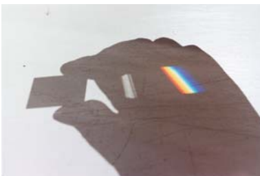
野口里佳 《手と虹》2010年、発色現像方式印画、460×690 mm

富士山は日本の象徴としてペリー艦隊から仰ぎ見られ、その92年後、戦艦ミズーリから再び撮影された。富士山の表象から近代日本史を辿り直し、霊峰富士の脱神話を試みた展覧会「富士幻景—富士にみる日本人の肖像」で展示された作品。