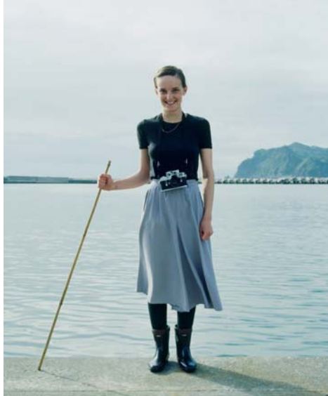
古屋誠一《Izu 1978》

本プレスリリース内でご紹介しました古屋誠一作品《Izu 1978》について画像（デジタルデータのみ）の貸出をしております。ご希望の場合はEメール、または必要事項をご記入の上FAXにてお申し込みください。