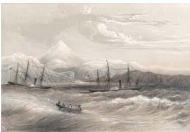
ウィリアム・ハイネ 《小田原湾》（『ペリー艦隊日本遠征記』より）1856年、石版画、152×224 mm

のみ 蚤の市で手に入れた写真や祖父のアルバムに見つけた写真などと、自身で撮影した写真を使用する作家。飛行機が写るこの2枚の写真も、かつてそれぞれの目的で制作されたものが、別々の経路で作家の手もとにたどり着き、再び見出されたもの。