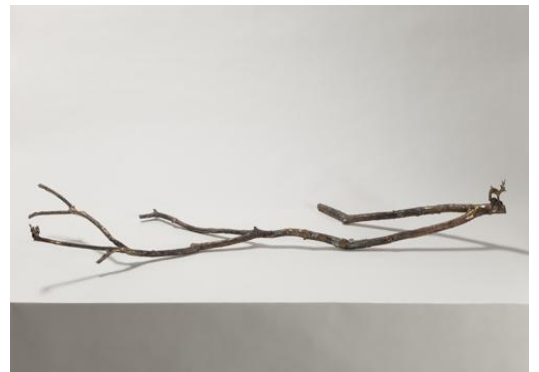
《kiLo》 2010年 ブロンズ