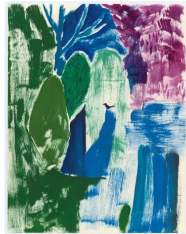
《The bird on a mouth》 2012年 油彩、紙