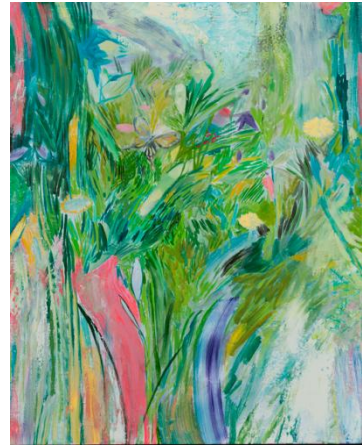
《light sleep》 2012年 油彩、カンヴァス