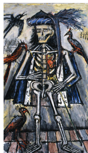
《死 No.16》 1999年、油彩

上の3点の作品につきまして、画像資料(デジタルデータ)をご用意しております。ご希望される場合は、作品画像下の口をチェック(レ)を入れ、必要事項をご記入の上、FAXにてお申し込みください。