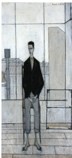
《アトリエの中の自画像》 1949年、油彩